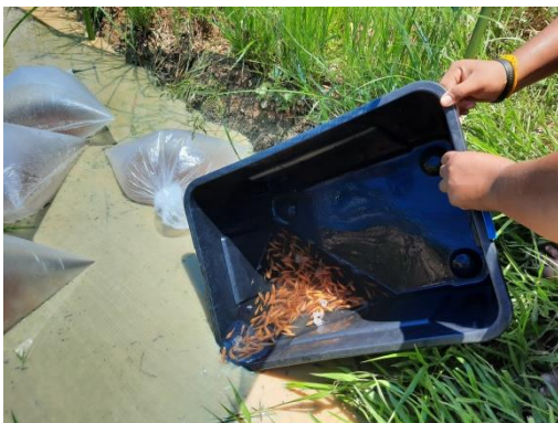
ภาพประกอบที่ 3 ปล่อยปลาแต่ละชุดการทดลองในแปลงนา