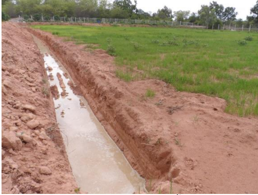
ภาพประกอบที่ 1 การขุดบ่อในแปลงนาสำหรับเลี้ยงปลาในนา ขนาดความกว้าง 1.50 เมตร ความลึก 0.5 เมตร

5. นำข้อมูลด้านอัตราการเติบโตมาคำนวณในโปรแกรมวิเคราะห์ข้อมูลทางสถิติ SPSS เพื่อวิเคราะห์และเปรียบเทียบค่าเฉลี่ย