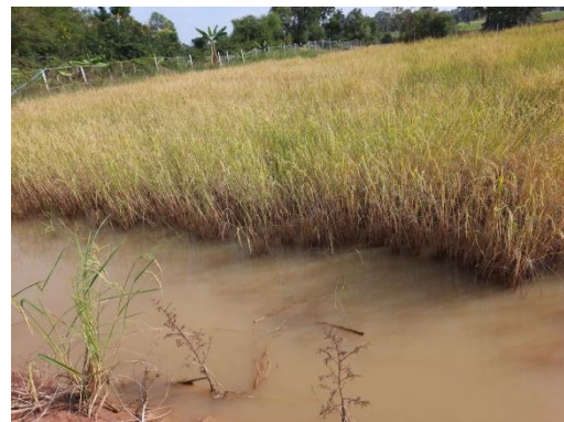
ภาพประกอบที่ 4 พื้นที่แปลงนาที่เลี้ยงปลาในระยะเวลา 4 เดือน และเตรียมเก็บเกี่ยวผลผลิต