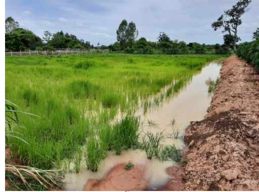
ภาพประกอบที่ 2 แปลงนาที่ปล่อยน้ำเข้าไปเพื่อเตรียมปล่อยปลาลงในนา